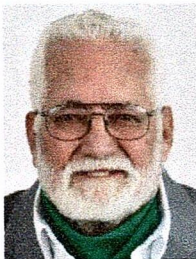
DIP. GUSTAVO DE LA ROSA HICKERSON