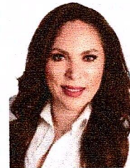
DIP. ANA GEORGINA ZAPATA LUCERO