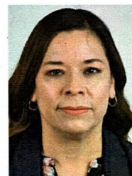
DIP. ROCIO GUADALUPE SARMIENTO RUFINO