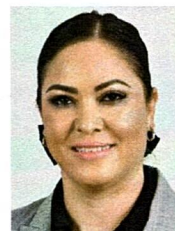
DIP. YESENIA GUADALUPE REYES CALZADÍAS