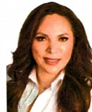
DIP. ANA GEORGINA ZAPATA LUCERO Vocal Partido Revolucionario Institucional