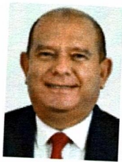
DIP. EDIN CUAUHTÉMOC ESTRADA SOTELO SECRETARIO