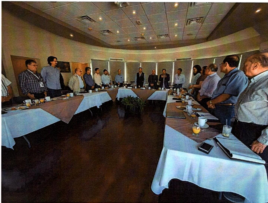
Mesa Técnica para el Análisis de las iniciativas 2013 y 2121 a efecto de expedir la nueva Ley de Desarrollo Forestal del Estado de Chihuahua.