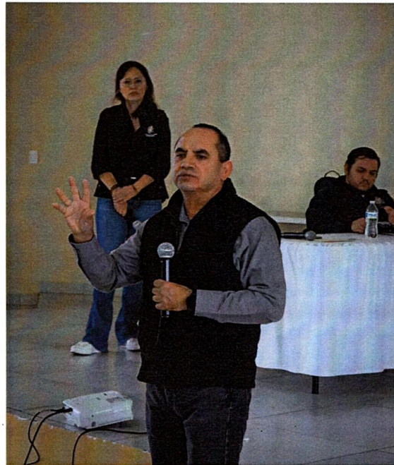
Foro en el municipio de Guachochi, Chihuahua