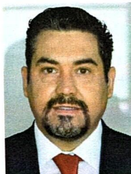
DIP. EDGAR JOSÉ PIÑÓN DOMÍNGUEZ