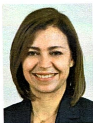
DIP. ROSA ISELA MARTÍNEZ DÍAZ