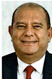
DIP. EDIN CUAUHEMOC ESTRADA SOTELO SECRETARIO